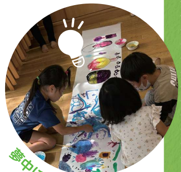
夢中になって遊び学ぶ